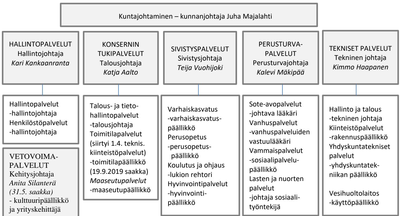
Kuva 2. Palvelualueet ja tilivelvolliset palvelualuejohtajat, vastualueet ja -päälliköt (valtuusto 12.12.2016 § 107, kunnanhallitus 19.12.2016 § 336 ja 24.4.2017 § 123, kunnanjohtaja 22.12.2016 § 39). Uuden hallintosäntöuudistuksen myötä palveluorganisaatio tuli voimaan 1.1.2017 alkaen, mutta perusturvapalveluiden osalta vasta 1.6.2017 alkaen. Vanhus- ja vammaispalvelut yhdistyivät 1.1.2020 alkaen (KH 2.9.2019 § 263) ja niiden vastuualuepäällikkönä toimii vanhus- ja vammaispalvelupäällikkö. Vetovoimapalvelut palvelualueena perustettiin 1.5.2018 lukien (Kvalt 23.4.2018), jonka palvelualuejohtajana kehitysjohtajan irtisanoutumisen jälkeen toimii kunnanjohtaja.