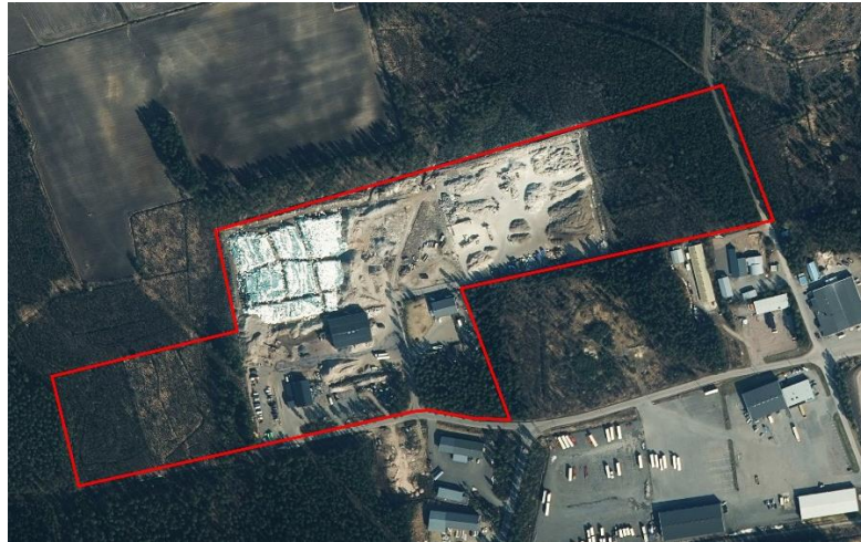
Kaava-alueen sijainti ja rajaus osoitekartalla ja ilmakuvassa.