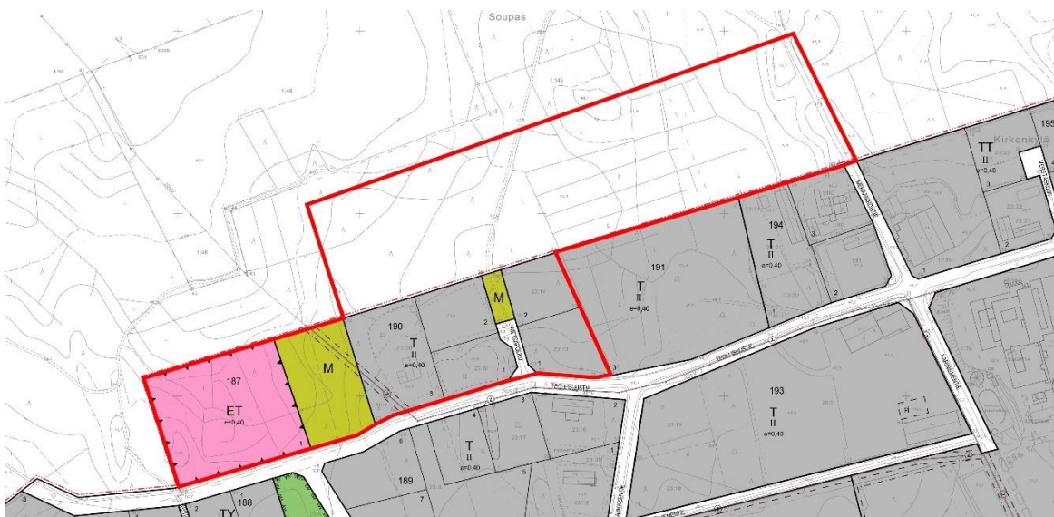
Ote voimassa olevasta asemakaavasta. Kaava-alueen likimääräinen sijainti on osoitettu punaisella viivalla.

Suunnittelualueella on voimassa Euran kunnanvaltuuston 16.6.2014 § 26 hyväksymä asemakaava. Voimassa olevassa asemakaavassa suunnittelualue on osoitettu teollisuus- ja varastorakennusten korttelialueeksi (T), maa- ja metsätalousalueeksi (M), yhdyskuntateknistä huoltoa palvelevien rakennusten ja laitojen alueeksi (ET) sekä katualueeksi (Metsäpolku). Lisäksi kaava-alueen läpi kulkee sähkölinjaa varten varattu alueen osa merkintä. Alueen suurin sallittu kerrosluku on kaksi ja rakentamistehokkuus e=0,40 .